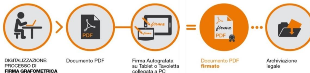
Fig.2 - Schema

I dati cifrati vengono successivamente inseriti nel pdf attraverso la creazione di una firma conforme allo standard europeo denominato PAdES. La soluzione prevede che, a sigillo di ogni firma apposta sul documento dal CLIENTE, sia applicato un certificato rilasciato da NAMIRIAL CA.