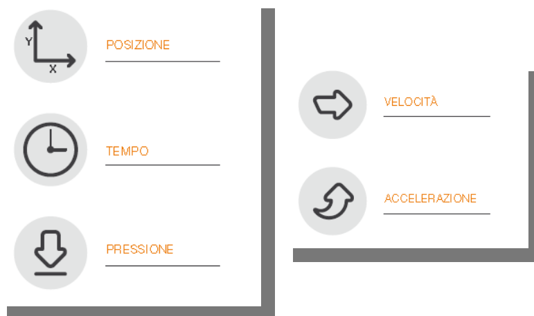
Fig.1 - Schema

Gli elementi disponibili nell'apposizione della sottoscrizione da parte del FIRMATARIO , sono i dati biometrici e comportamentali, quali: Posizione della penna, Pressione, Tratto in aria (percorso che fa la penna quando non tocca nel device, fino a 1cm ), e Tempo. E' possibile elaborare velocità e accelerazione ai fini di analisi forensi.